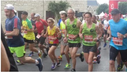
Une cinquième édition en forte croissance